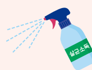
사용 물품 소독하기